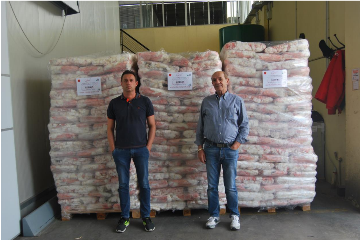
我们在我们卖的兔皮前面合影